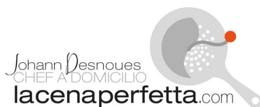
TABELLA DELLE ALLERGENI ALIMENTARI